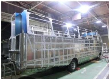
水陸両用バスの枠組製造