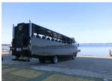
検査・試験等を経て