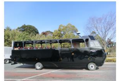
形になってきました